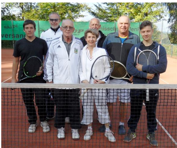
Die Erfolgreichen auf einen Blick