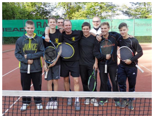
Einige der stolzen Aufsteiger