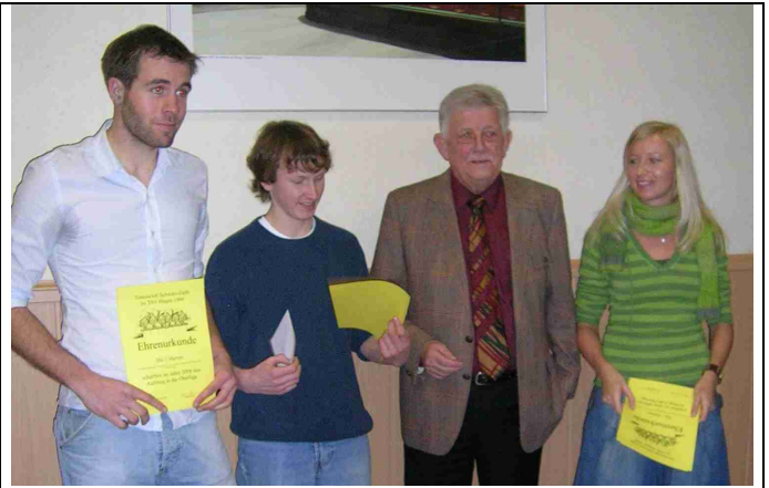
1. Herrenmannschaft für den Aufstieg in die Oberliga Westfalen