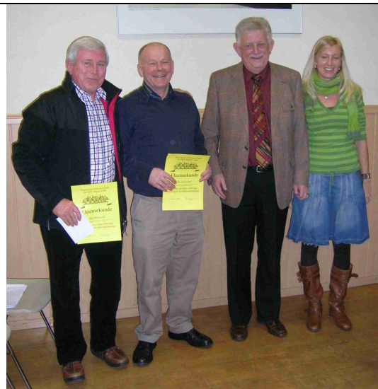
1. Herrenmannschaft 60 für den Aufstieg in die Südwestfalenliga