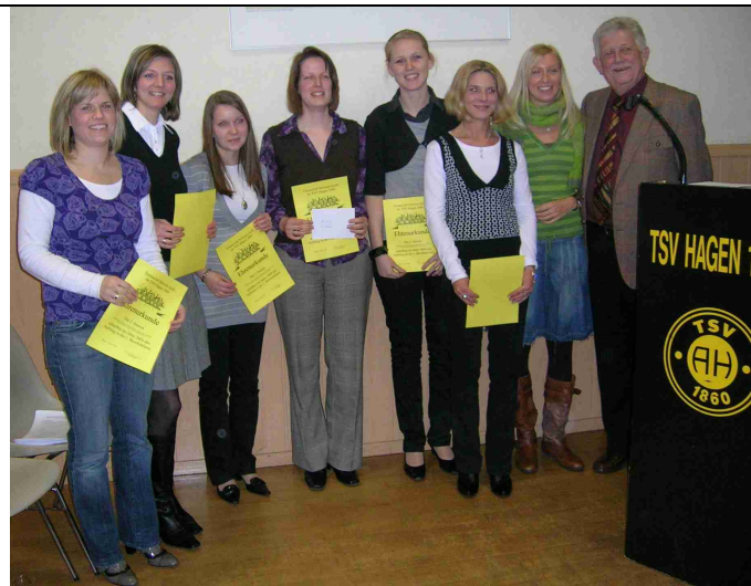
2. Damenmannschaft für den Aufstieg in die 1. Bezirksklasse